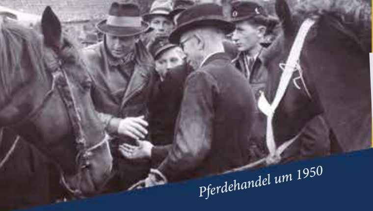
Pferdehandel um 1950